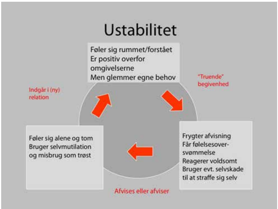
Figur 2. Mennesker med borderline kan befinde sig i en "følelses-karrusel" med ustabil humør.

Selvdestruktive handlinger ses også i form af misbrug . Over 2/3 af mennesker