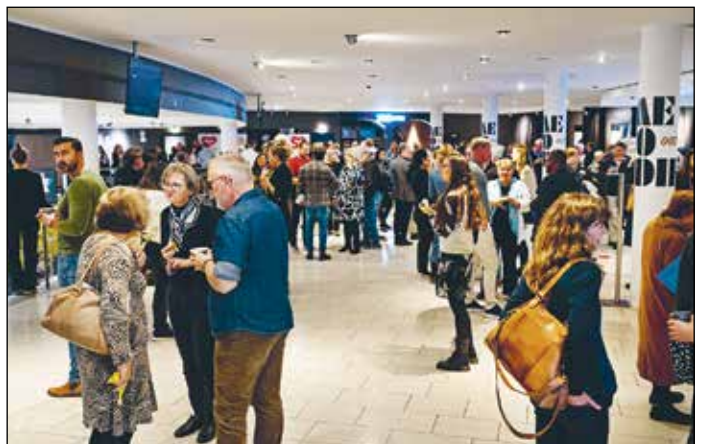
Traditionen tro benyttede mange deltagere pauserne til at drøfte ideer og samarbejde med andre