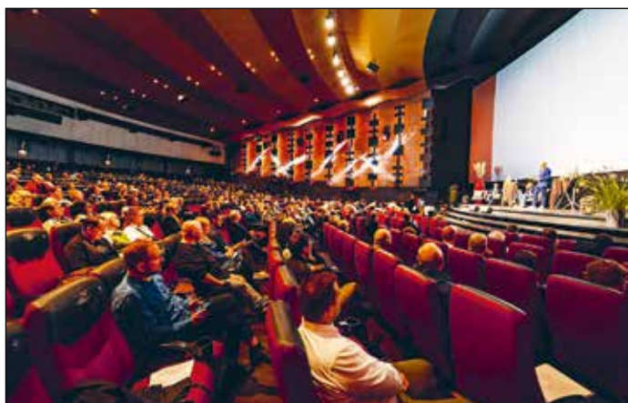
Psykiaritopmødet kunne følges hjemmefra online, men mange foretrak at møde frem i biografen Imperial

Som altid blev Psykiaritopmødet i år en inspirerende omgang. Det var på forhånd planlagt, at topmødet skulle handle om regeringens 10-årsplan for psykiatrien, men i takt med at topmødet rykkede tættere på, stod det klart, at coronanedlukninger, vacciner og testkapacitet betød, at regeringen med sundhedsminister Magnus Heunicke er blevet forsinket med planen.