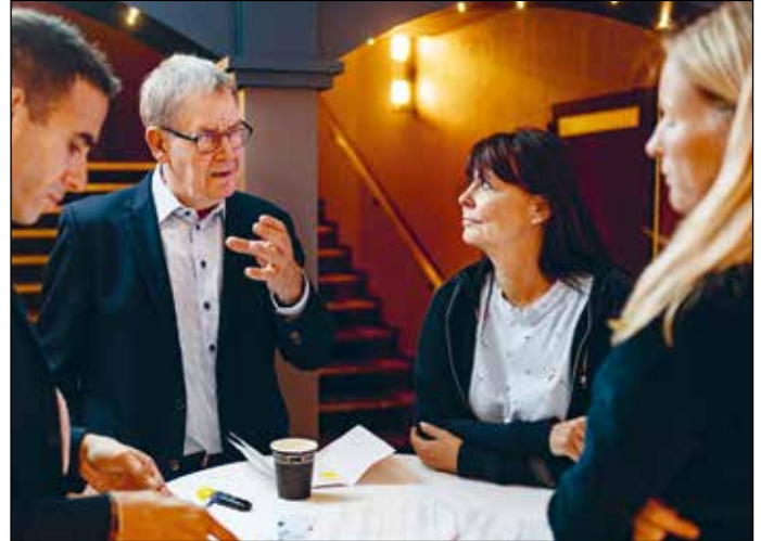
De sidste detaljer drøftes, kort før Psykiatrimødet begynder