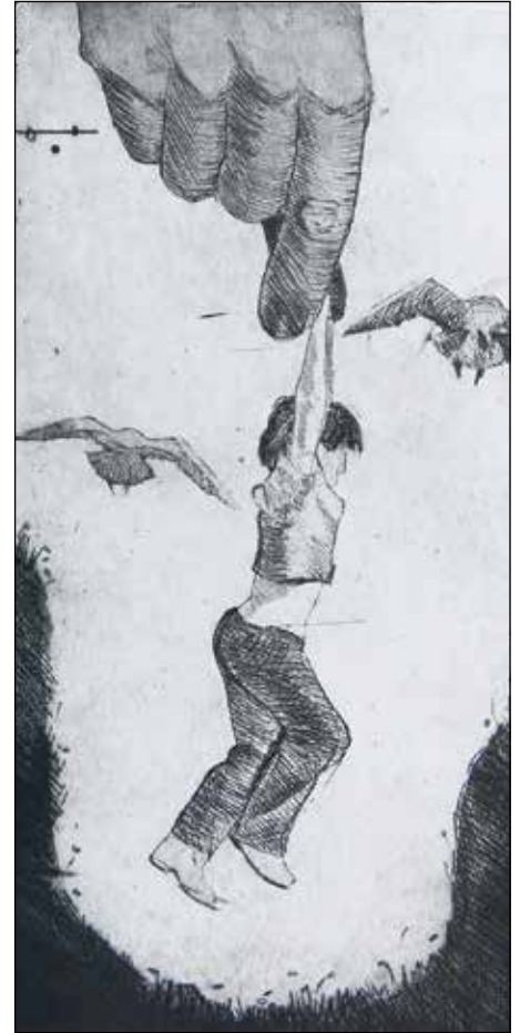
De forskellige motiver afspejler lyspunkter og mørke perioder i kunstnerens liv