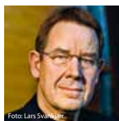
Poul Nyrup Rasmussen