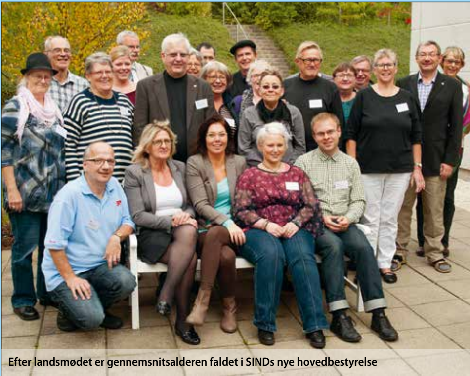
Efter landsmødet er gennemsnitsalderen faldet i SINDs nye hovedbestyrelse