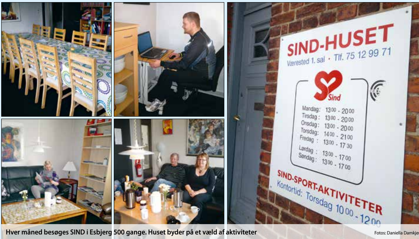
Hver måned besøges SIND i Esbjerg 500 gange. Huset byder på et væld af aktiviteter