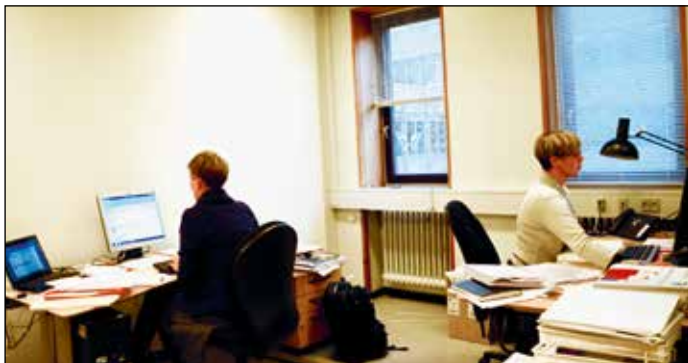
Hos SINDs Pårørenderådgivning har ansatte og frivillige specialviden på mange områder

AF HENRIK HARRING JØRGENSEN. FOTOS: ANDREAS KILDEN