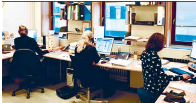
Telefonerne ringer ofte i Risskov

I mange år har SIND påpeget, at det ikke er let at være pårørende – slet ikke for et barn med en psykisk syg far eller mor. Børnene har brug for hjælp, men der er alt for få tilbud. Flere og flere politikere er nu også blevet opmærksomme på problemet. Både via SIND og via andre, der opsøger politisk indflydelse. Fx var emnet fremtrædende i debatten, da SIND ved sommerens Folkemøde på Bornholm samlede folketingsmedlemmer fra alle partier til et offentligt møde. I slutningen af oktober reagerede politikerne så: Ved fordelingen af midler fra Satspuljen blev 9,8 mio. kr. afsat til