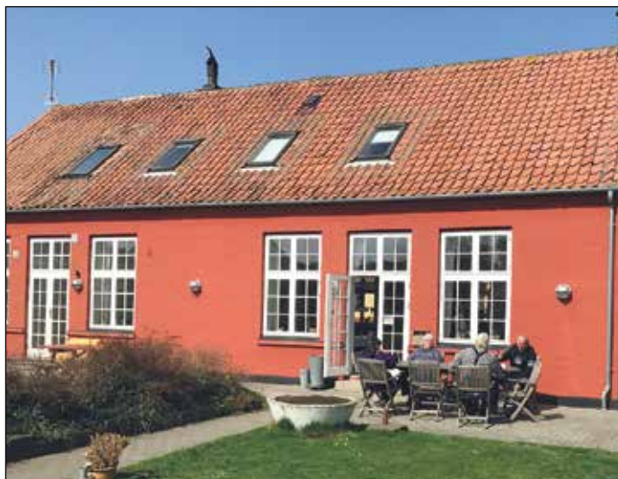
Gården bruges flittigt, når vejret er godt

AF HENRIK HARRING JØRGENSEN.