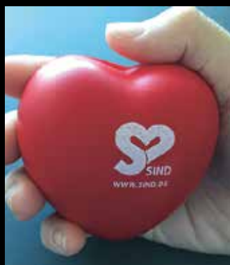
Hjerteformet antistressbold med SIND-logo. Pris: 15,-