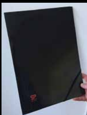
Sorte mapper med SIND-logo. Pris: 20,-