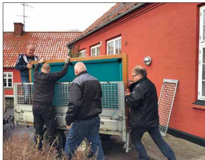
Brugerne af huset besluttede selv at skille sig af med billardbordet for at få plads til andre aktiviteter

"På husmøderne beslutter vi fx fælles udflugter eller ændringer af indretningen. Vi har lige flyttet vores billardbord, fordi vi gerne vil bruge pladsen til noget andet, hvilket næsten alle brugere var med til at vedtage. Sådan skal det være. Det er jo først og fremmest deres værested," siger hun.