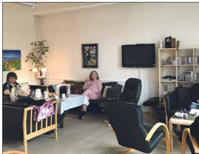
Dagligstuen er omdrejningspunktet omkring næsten alle aktiviteter

Året rundt minder atmosfæren i Værestedet i Allinge nærmest om en mellemting mellem en god kaffereklame og de første sekunder af tv-serierne "Matador" og "Sams Bar": Hyggeligt, velkendt og venskabeligt. Man mærker hurtigt, at Værestedets brugere kender hinanden og kan lide at være sammen.