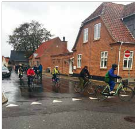
Også i regnvejr tager idrætsforeningens cykelhold på cykeltur

AF JULIE HORNSTRUP ØSTERGAARD.