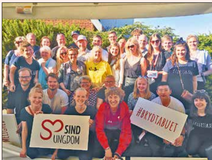
Alle i teltet deltog aktivt og med stor personlig indlevelen i samtalsalonen

AF METTE VESTERGAARD, DAGLIG LEDER, SIND UNGDOM. FOTO: GALINA NORDBY, SIND UNGDOM