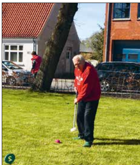
Leif fra SIND-Huset koncentrerer sig til krolf

I april 2017 afsluttede Morsø Kommune, der ligger midt i Limfjorden imellem Salting og Thy, et toårigt sundhedsprojekt med fokus på at forbedre den mentale og fysiske sundhed for borgere med psykisk sygdom. SIND i Nykøbing Mors har i samarbejde med blandt andre Morsø Kommune, Dansk Arbejder Idrætsforbund (DAI), Dansk Handicap Idrætsforbund (DHI) og Landsforeningen LEV bidraget til projektet, der er mundet ud i en ny idrætsforening på øen. Idrætsforeningen får SIND-medlemmer og andre interesserede til fx at snøre fodboldstøvlerne, trække i cykelshortsene og ryste kroppen til tonerne af latin-amerikansk musik.