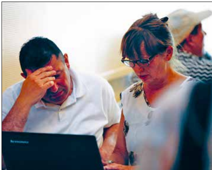
Muhabet er et multikulturelt værested for psykisk syge og sårbare indvandrere og deres pårørende