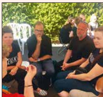
I mindre samtalegrupper blev unges psykiske sårbarhed diskuteret

Vi tror sørme, vi gør det igen til næste år!