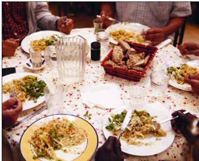
Værestedet serverer mad inspireret fra forskellige madkulturer