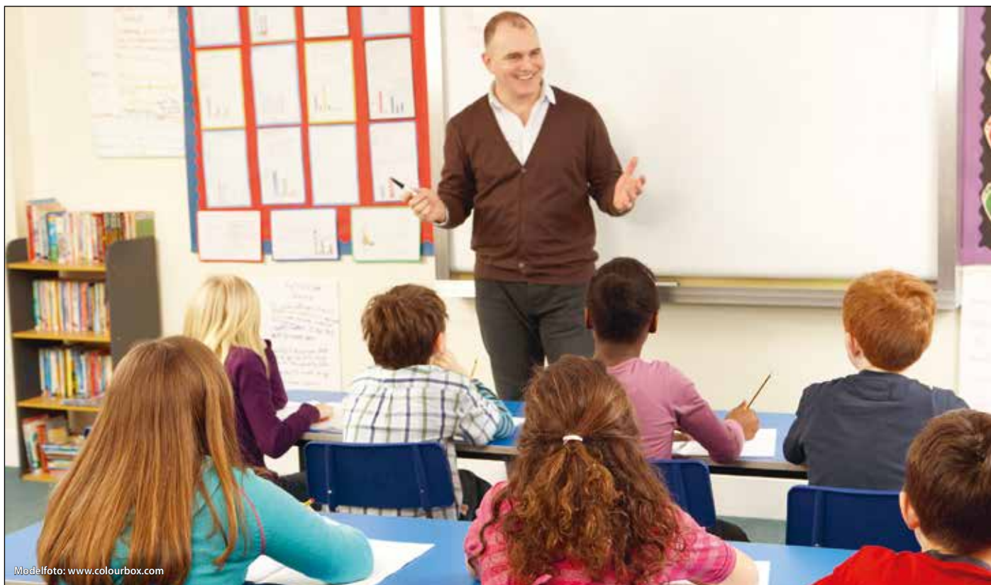
4.000 skoleelever har deltaget i undervisningsforløb om psykisk sygdom. 400 har deltaget i et samtaleforløb. (Modelfoto)

Det er svært at være pårørende til en person med psykisk sygdom. Det gælder ikke mindst for de skolebørn, hvor det er et nært familie-medlem, der er ramt. Mange tanker og spørgsmål melder sig, men det kan være svært at tale om udfordringerne af frygt for, hvordan omgivelserne reagerer. Når det at være pårørende er et tabubelagt emne, kan det føre til en følelse af ensomhed og gøre det ekstra udfordrende at skabe mening i en hverdag, hvor både skole og fritidsaktiviteter også skal passes.