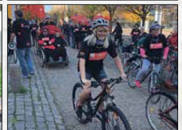
Sindets dag var begivenhedsrig i Frederikshavn og mange andre byer