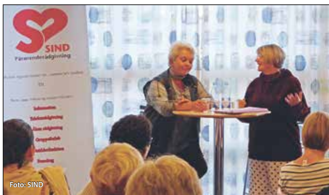
Både eftertænksomme miner og store smil prægede publikum