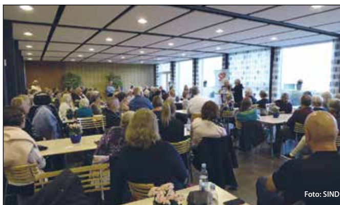
Mange mødte frem til foredraget