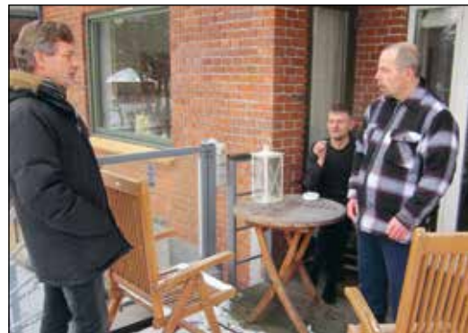
Opgangsfællesskabet minder ikke om en institution, men om en almindelig bolig