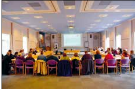
Deltagernes baggrund var vidt forskellig. Fællestrækket for gruppen var et højt engagement i rollen som hjælper