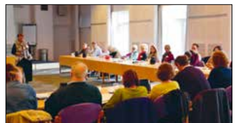
SIND fordoblede deltagerantallet til forårets kursus for nye bisiddere og rådgivere