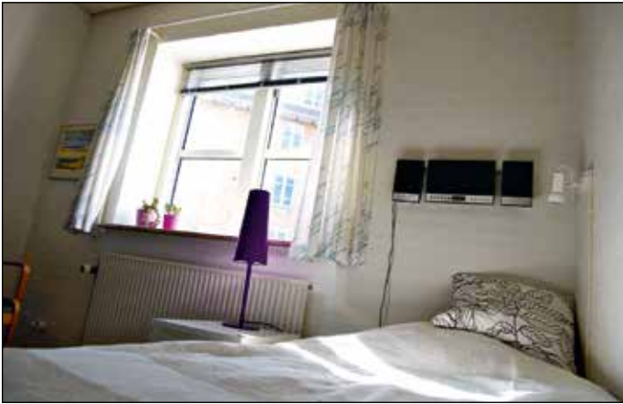
Psykiatriens hus rummer bl.a. et akut døgntilbud med 6 kommunale og 6 regionale pladser til midlertidige ophold