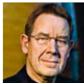
Poul Nyrup Rasmussen