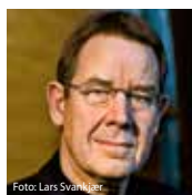
Poul Nyrup Rasmussen