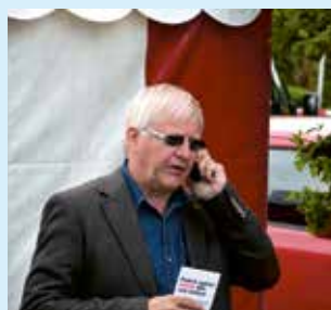
Landsformand Knud Kristensen telefoninterviewes af en TV 2-journalist fra Jylland