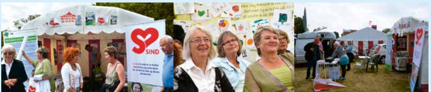
Stemning og aktivitet i teltet og ved arrangementerne