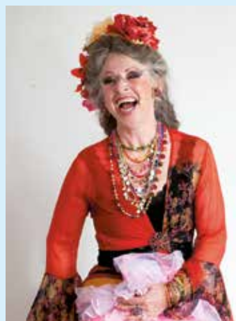
Få kan som Anne Marie Helger forene alle i et lokale i fælles, klukkende latter