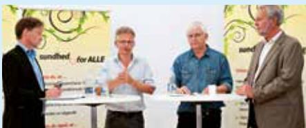
SIND, Fagforbundet FOA og KAB afholdt fælles debatmøde om oversete psykisk syge