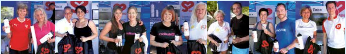
41 politikere deltog i "Tramp for SIND". Flere erklærede, at de meget gerne stiller op til næste år