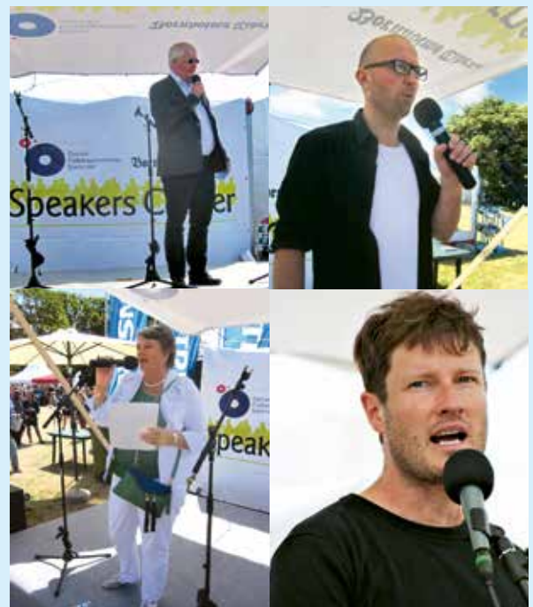
Spakers Corner – Folkemødets åbne talerstol – havde ofte besøg fra SIND

musikfestival og valgkampskulmination tilsat så blændende sommervej, at selv de prangende postkort i stativerne i havnekiosken virkede grå og efterårsagtige.