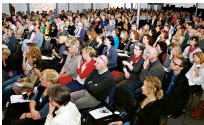
600 deltog i konferencen

De gennemgående budskaber nåede helt ned på bagerste række, både på engelsk og dansk. Man skal tænke recovery som en proces og ikke som et enkeltstående terapeutisk tiltag. Priorité et større fokus på det enkelte menneskes ressourcer, frem for på diagnosen.